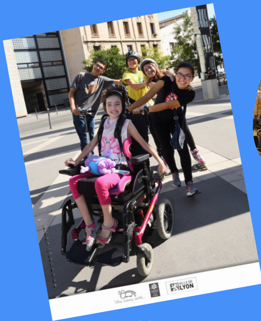
Exposition photo "Et si on changeait de regard !"

Tout au long de l'année, Une Souris Verte organise différents évènements pour sensibiliser et informer le grand public sur les questions de l'accueil inclusif, de la pleine participation sociale et du parcours de vie des familles concernées. L'association interpelle également les élus, responsables politiques et institutions autour de ces thèmes pour engager des dynamiques inclusives à la hauteur des besoins des familles.