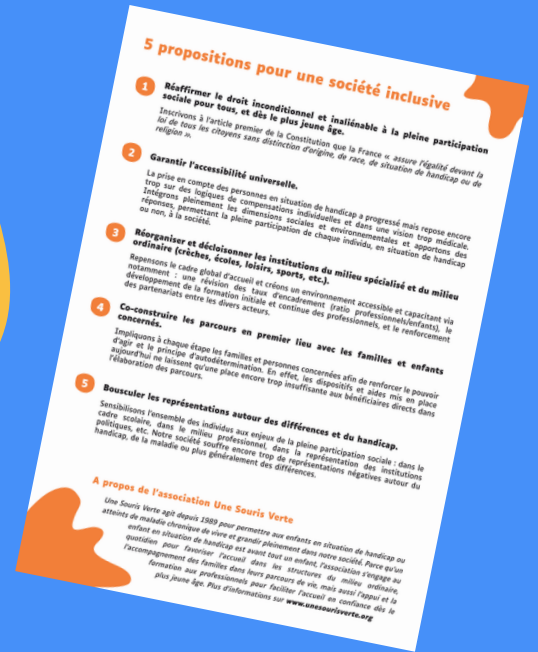
Lettre ouverte aux candidat(e)s à l'élection présidentielle 2022