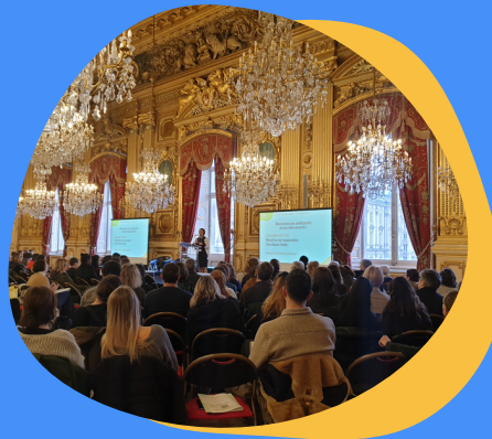
Journée d'Etude Enfance & Handicap à l'Hôtel de Ville de Lyon